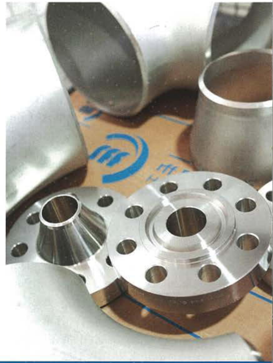
Kunden können auf einen zuverlässigen Lieferservice vertrauen, wenn es um Rohre, Flansche und Fittings geht

Basierend auf einem umfangreichen Lieferprogramm und großem Vorrat in den beiden Zentrallagern für Rohrverbindungen beziehungsweise Rohre setzt rff auch weiterhin auf einen hohen Lieferservice. Viele Unternehmen aus der Industrie vertrauen auf Partner, die in Sachen Materialqualität